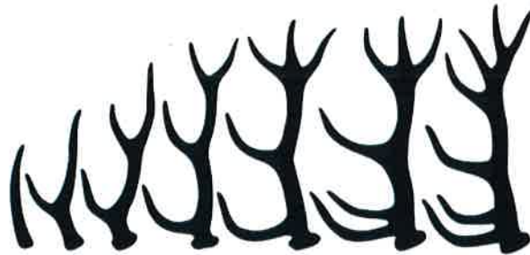
Schematische Geweihentwicklung beim Rothirsch

Gut zu wissen: Das Geweih des Rehbocks wird in der Jägersprache von manchem als Gehörn bezeichnet, dies hat aber nichts mit dem Horn zu tun!