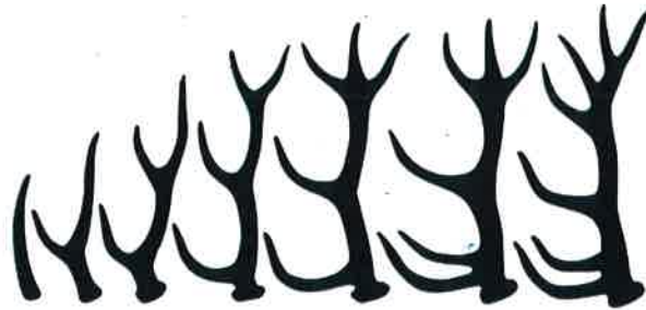
Schematische Geweihentwicklung beim Rothirsch

Gut zu wissen: Das Geweih des Rehbocks wird in der Jägersprache von manchem als Gehörn bezeichnet, dies hat aber nichts mit dem Horn zu tun!